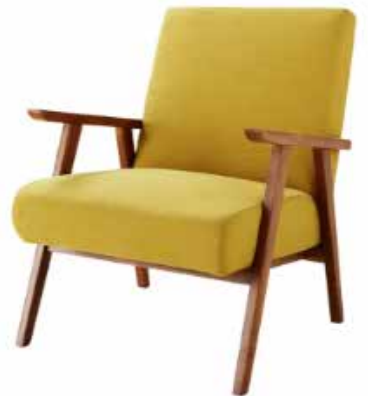
Fauteuil moutarde Hermann et commode vintage Fjord